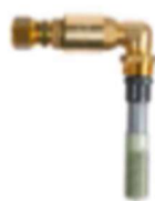
5 Diffusörarmatur inkl. backventil